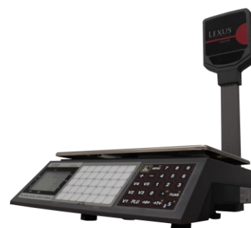
FOXTER T 70