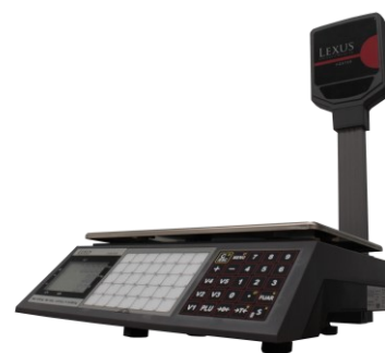
FOXTER T 70